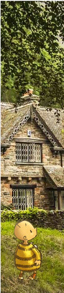
Das Haus am Wald mit Waldcafé und Waldkino